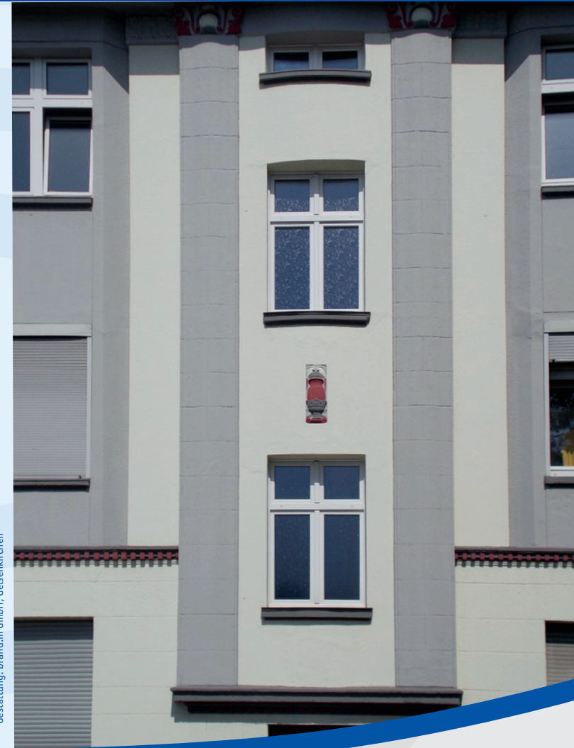
Gestaltung: brand.m GmbH, Gelsenkirchen

für Haus- und Wohnungseigentümer in Schalke